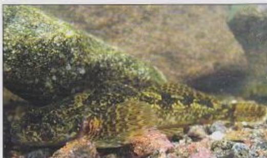
Vranka obecná ( Cottus gobio )

Předmět ochrany: Chráněna je zde vranka obecná ( Cottus gobio ), která se zde vyskytuje ve vysokém počtu.