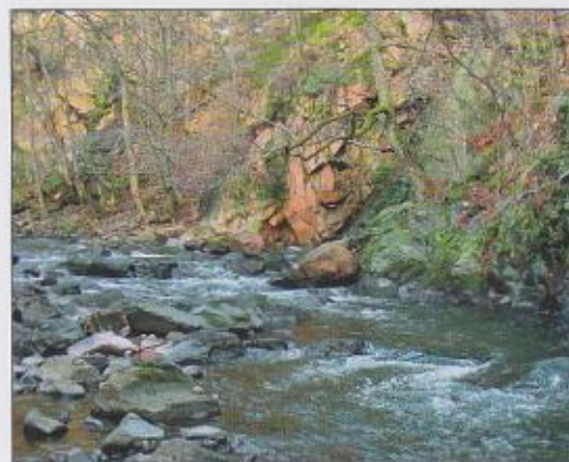
Chrudimka v PR Strádovské Peklo

Ochrana a management: Území je součástí PR Krkanka a PR Strádovské Peklo. Zásahy v korytě se omezují na odstraňování padlých stromů a pomíst- ních nánosů, popřípadě na zpevňování břehů. Území je přístupné po značených cestách. Ve Slavické oboře je vstup omezen v závislosti na omezení vstupu do obory.