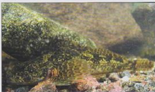
Vranka obecná ( Cottus gobio )

Předmět ochrany: Chráněna je zde vranka obecná ( Cottus gobio ), která se zde vyskytuje ve vysokém počtu.