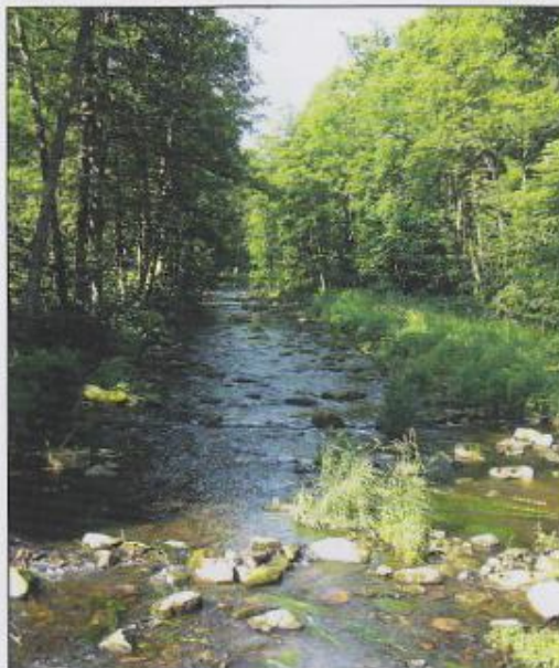
Chrudimka v PR Krkanka

vodu na pole, nebo by zde došlo k havárii. V případě zásahů do vlastního toku je třeba šetrných a plošně malých prací.