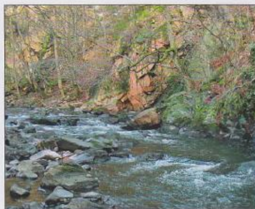
Chrudimka v PR Strádovské Peklo

Ochrana a management: Území je součástí PR Krkanka a PR Strádovské Peklo. Zásahy v korytě se omezují na odstraňování padlých stromů a pomístních nánosů, popřípadě na zpevňování břehů. Území je přístupné po značených cestách. Ve Slavické oboře je vstup omezen v závislosti na omezení vstupu do obory.